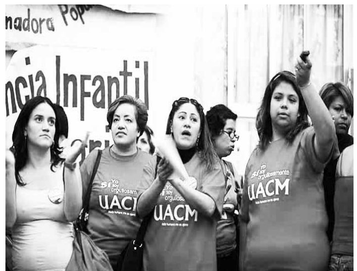
5. Algunas de estas ideas fueron presentadas por la autora en la IX Conferencia Internacional de la Coalición Trinacional en Defensa de la Educación Pública, en Montreal, Canadá, en 2009.

Varias acciones podemos desprender de esta experiencia y que puede ser asumida por directivos, académicos y sindicatos, tanto a nivel nacional como internacional. Aquí algunas propuestas